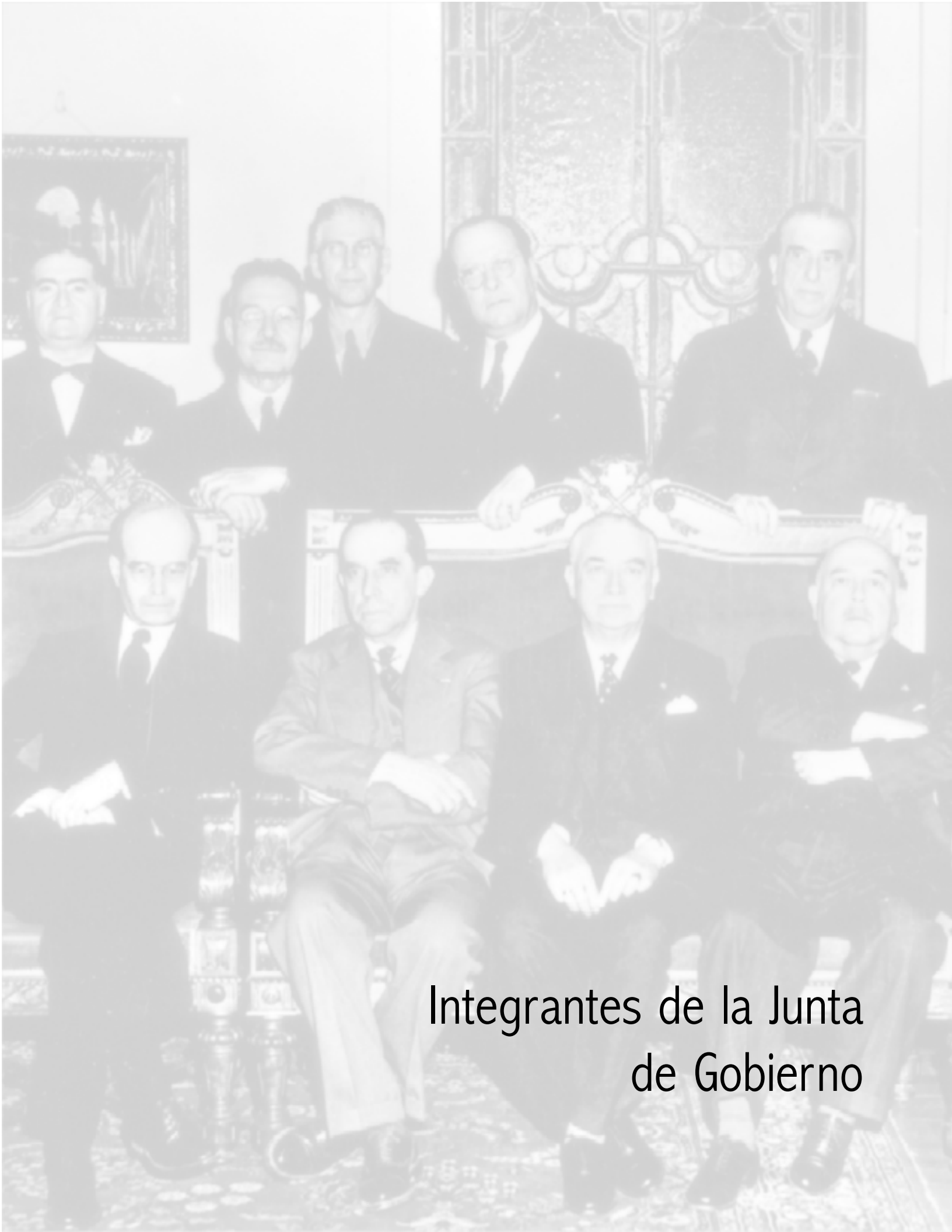
Integrantes de la Junta de Gobierno